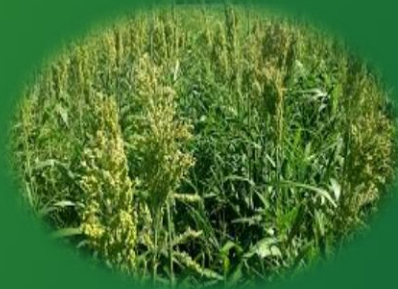
Cultivo de Cobertura