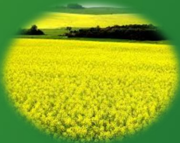
Rotação de Cultura